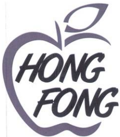
ශිතාංජලී ආර්. රණවක, බුද්ධිමය දේපළ අධ්‍යක්ෂ ජනරාල්.

(1) ලකුණෙහි අංකය: 216578; (2) ලැබුණු දිනය: 2017.03.03; (3) ප්‍රමුඛතාව ඉල්ලා සිටින්නේ නම් දිනය:-; (4) ඉල්ලුම්කරුගේ නම සහ ලිපිනය: සැමෙන්මියා හොන්ග්ලොන්ග් ෆාට්ස් ඇන්ඩ් වෙජිටබල්ස් කම්පැණි ලිමිටඩ්, නම්බර් නයින්, යුනිට් 02, බිල්ඩින්ග් 2, ෆෝන් යාඩ්, ෆෝන් ලේන්, ඕයෝෂාන් රෝඩ්, සැන්මෙන්මියා සිටි, හෙනැන්, මහජන චීන සමූහාණ්ඩුව; (5) ලිපි භාර දීම සඳහා මෙරට ලිපිනය: නීලකන්දන් සහ නීලකන්දන් මහකුන් (නීතිඥවරු හා ප්‍රසිද්ධ නොතාරිස්වරු), නැ.පෙ. 749, එම් ඇන්ඩ් එන් බිල්ඩින්ග් (05 මහල), නො.02, ඩීල් පෙදෙස, කොළඹ 03; (6) පංතිය: 31; (7) භාණ්ඩ හෝ සේවා: 31 ඇට වර්ග (පලතුරු); පැණිරි සහිත පලතුරු, නැවුම් දොඩම්; නැවුම් පලතුරු; නැවුම් මිදි; නැවුම් එළවළු; ශාක; ආහාර සඳහා නැවුම් බීමමල්; ඇපල්; පෙයාර්ස්; මහ සිදරන්; (8) ලකුණේ නියෝජනය: